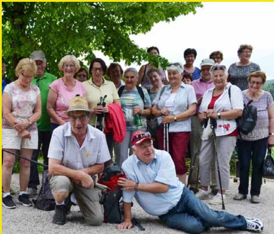
Aktiver Seniorenbund Aspach mit zahlreichen Sommeraktivitäten