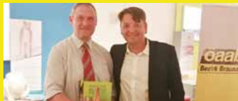
Obmannwechsel bei der ÖAAB-Ortsgruppe Aspach Seite 22-23