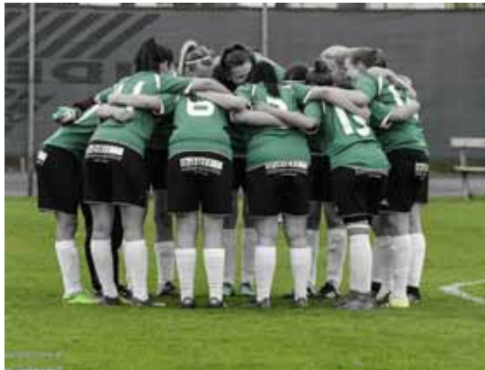
Mannschaftskreis vor einem Meisterschaftsspiel im Frühjahr.

Erwähnenswert ist, dass unsere Mannschaft mit insgesamt 41