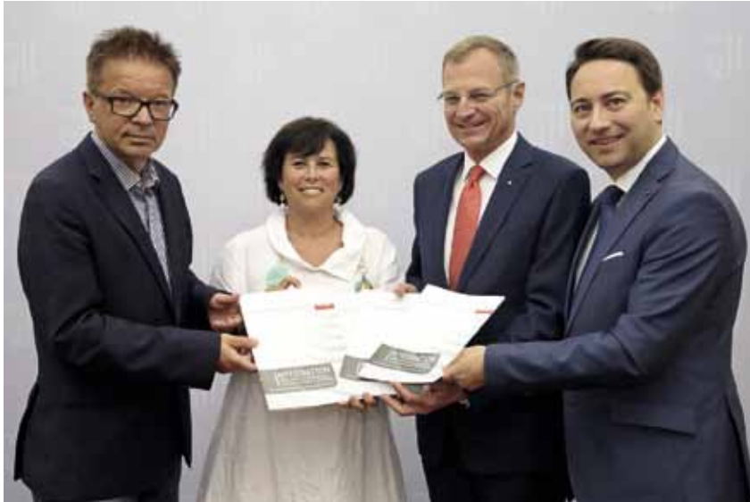
Das Oö. Integrationsleitbild wird von allen vier Parteien im Landtag mitgetragen.

Oberösterreich bekommt ein neues Integrationsleitbild. „Es geht darum, klar und deutlich zu vermitteln, wie wir uns das gemeinsame Leben in unserer Heimat vorstellen. Denn wer das Zusammenleben in unserem Land erhalten will, darf bei der Integration nicht nachlässig sein“, betont Landeshauptmann Thomas Stelzer.