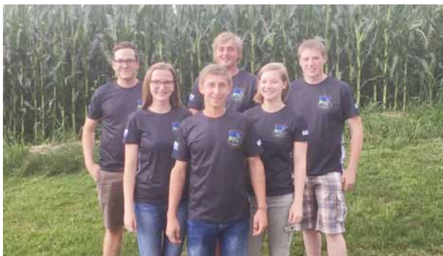
Hier im Bild der frisch gewählte Vorstand der Faschingsfreunde Wildenau