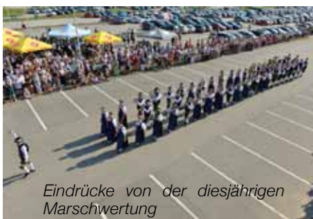
Eindrücke von der diesjährigen Marschwertung

Bei den Jungmusikern der Solinger wird üblicherweise einmal monatlich fleißig für die verschiedensten Auftritte, wie zum Beispiel im Revital, geprobt. Selbstverständlich darf auch der Spaß nicht zu kurz kommen und deshalb wurde vor der Sommerpause am 20. Juli wieder ein Probenstag mit anschließendem Zelten