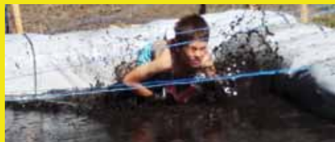
Aspacher Ferienprogramm voll im Gange – Bericht des Familienausschussobmann Seite 10-11