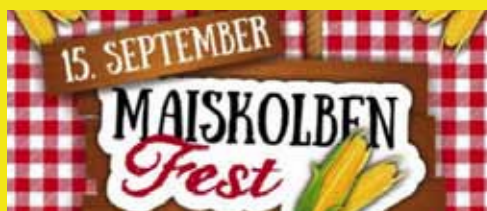
Landjugend Aspach Maiskolbenfest – Seite 56-57