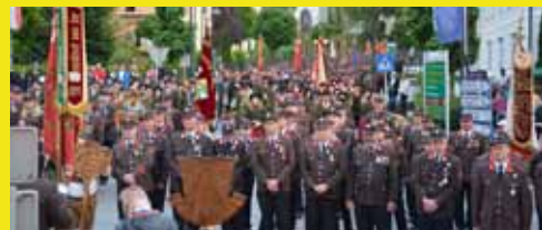
Neueste Information von den 4 Freiwilligen Feuerwehren Seite 32-39